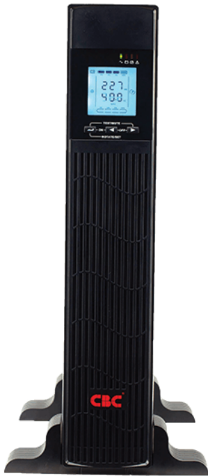
Rack mount ขนาด 2 U

CBC ® Group UPS Uninterruptible Power Supply